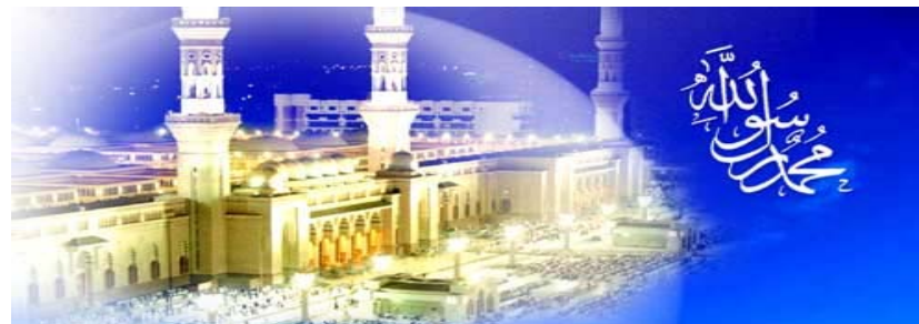
مبعث در آیین اندیشه و کلام امام خمینی

چنانچه در آیه شریفه سوره «هود» می فرماید: مَا مِنْ دَابَّةٍ إِلَّا هُوَ آخِذٌ بِنَاصِيَتِهَا إِنَّ رَبِّي عَلَى صِرَاطٍ مُسْتَقِيمٍ؛ «صراط مستقیم را به رب محمد صلی الله علیه و آله نسبت داده، و این علاوه بر تناسب مقام استقامت مطلقه با رب انسان کامل، به واسطه غایت عنایت به مطلوب، این اضافه مذکور شده.